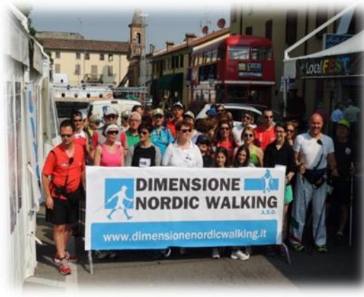
Partenza della tappa Nordic Waling in Tour Bondeno giugno 2014 organizzata da Asd Dimensione Nordic Walking nell'ambito di LocalFest

OPZIONE C: euro 17,00 - passeggiata&pranzo completo, ovvero primo piatto a scelta fra sedanini al sugo d'anguilla o pennette alla pescatora (seppie, gamberi, calamari, coda di rospo e polpa di cozze); secondo a scelta fra fritto di valle alla Comacchiese (ovvero con bagigini e schille) o seppie con piselli e polenta + bicchiere di vino e mezzo litro d'acqua, pacco di partecipazione e ristori